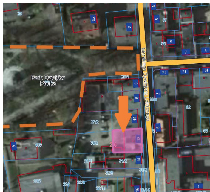
Nieruchomość położona przy ul. Morskiego Dywizjonu Lotniczego 12