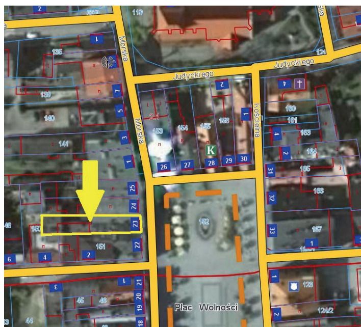
Nieruchomość położona przy Starym Rynku 23