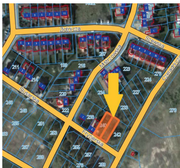
Nieruchomości położone przy ul. Fryzjerskiej