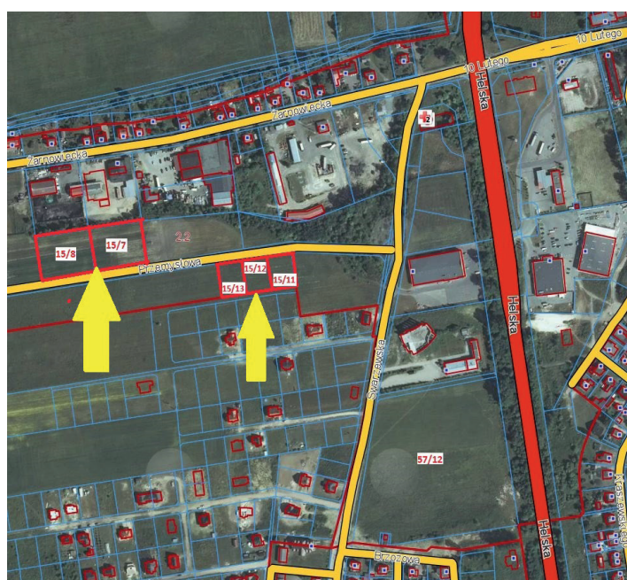
Nieruchomości położone przy ul. Przemysłowej