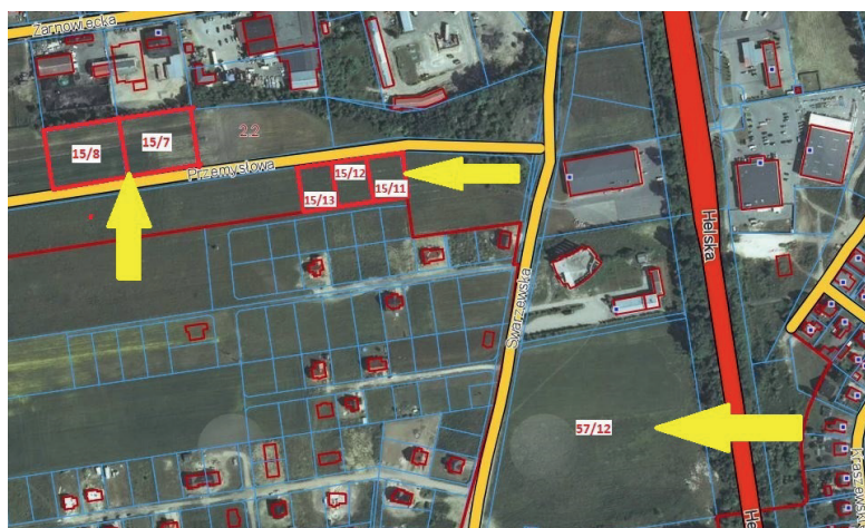
nieruchomości przy ul. Swarzewskiej przeznaczonej do zabudowy usługowej, w tym usług hotelowych i pensjonatowych