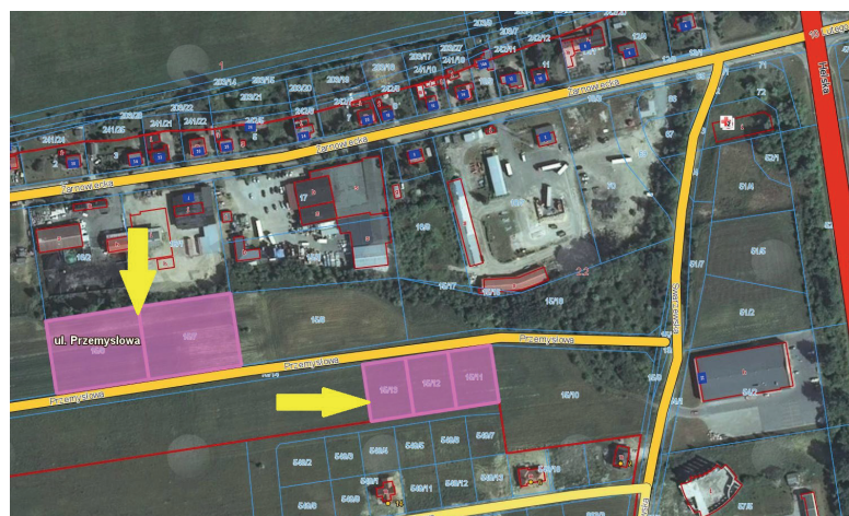
nieruchomości przy ul. Przemysłowej przeznaczone do zabudowy usługowej i produkcyjnej