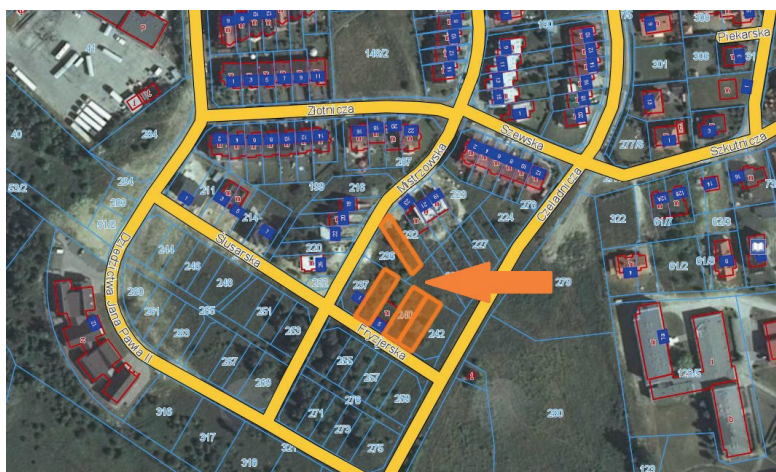
nieruchomości przy ul. Mistrzowskiej i ul. Fryzjerskiej przeznaczone na cele śródmiejskiej zabudowy mieszkaniowej jednorodzinnej szeregowej