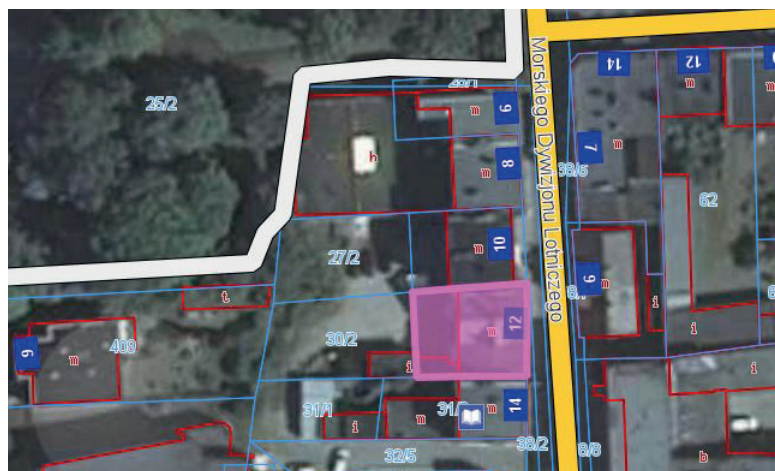
nieruchomość przy ul. Morskiego Dywizjonu Lotniczego przeznaczona na cele śródmiejskiej zabudowy mieszkaniowo-usługowej