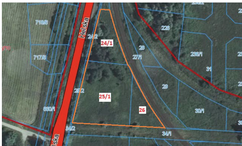
działka przy ul. Helskiej przeznaczona pod zabudowę usługową w tym usług hotelowych i pensjonatowych oraz usług biurowych