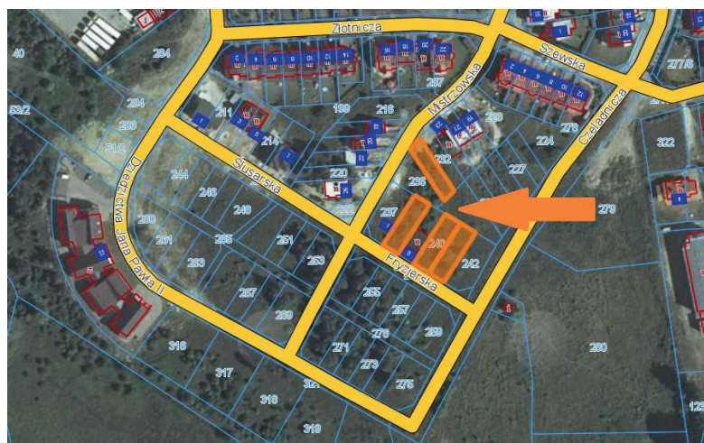
działka położona przy ul. Mistrzowskiej oraz ul. Fryzjerskiej przeznaczona pod zabudowę mieszkaniowo-usługową