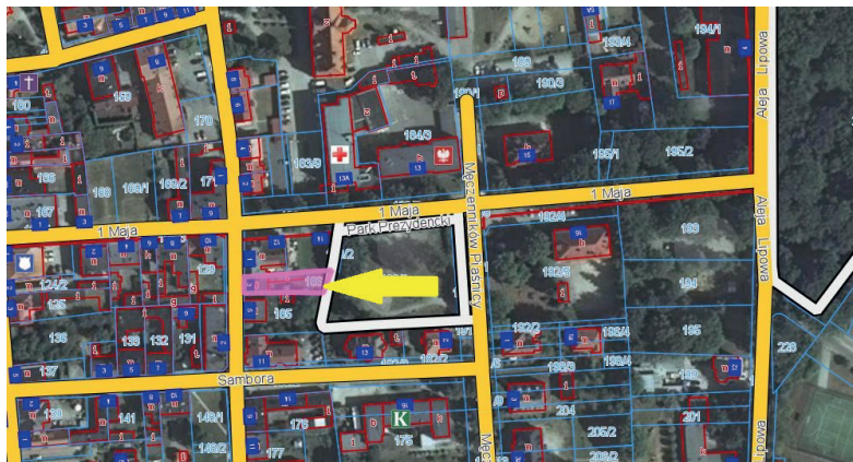
nieruchomość położona przy ul. Sobieskiego