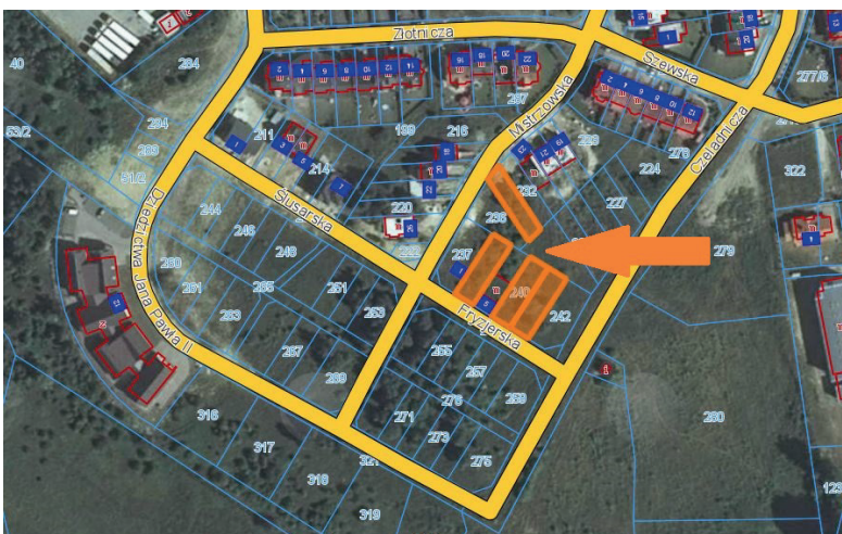
działka położona przy ul. Mistrzowskiej oraz ul. Fryzjerskiej przeznaczona pod zabudowę mieszkaniowo-usługową