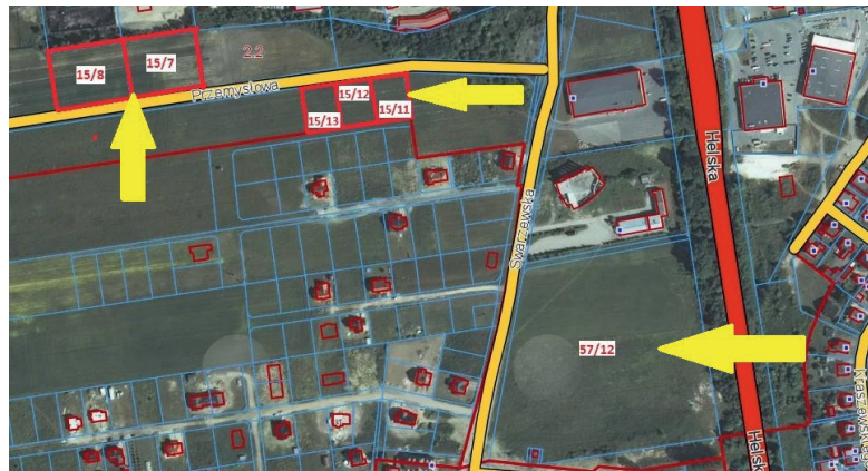
działki położone przy ul. Przemysłowej oraz ul. Swarzewskiej