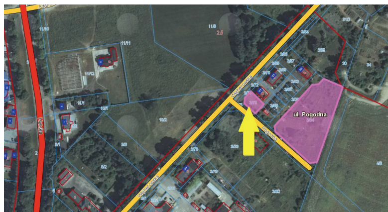
działka położona przy ul. Pogodnej przeznaczona pod zabudowę mieszkaniowo-usługową