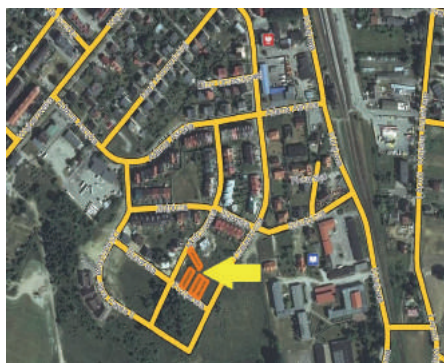
nieruchomość przy ul. Fryzjerskiej i ul. Mistrzowskiej (pod zabudowę mieszkaniową szeregową)