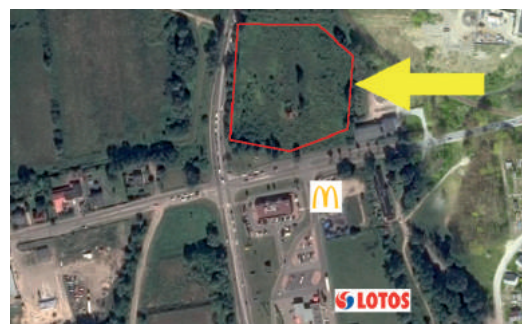
nieruchomość przy ul. 10- Lutego (pod zabudowę usługową)