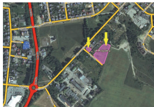
nieruchomość przy ul. Pogodnej (pod zabudowę mieszkaniowo-usługową)