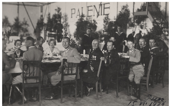
Fot. 3 Uroczysty obiad w hangarze MDL, Puck 15.07.1932 r