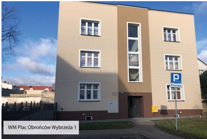
WM Plac Obrońców Wybrzeża 1

Obecnie prace remontowe prowadzone są w 2 budynkach wspólnot. Wspólnota Mieszkaniowa przy ulicy Generała Józefa Hallera 11 zleciła przemurowanie kominów, uszczelnienie kaletnicy, malowanie okapu, docieplenie dachu, izolację ścian fundamentowych, wymianę stolarki okiennej, zabezpieczenie nadproży w poziomie piwnicy. Ponadto wykonane zostanie odwodnienie terenu, nasadzona zostanie zieleń, pojawią się elementy małej architektury a sam teren zostanie doświetlony. Prace potrwać do 29 lipca br.