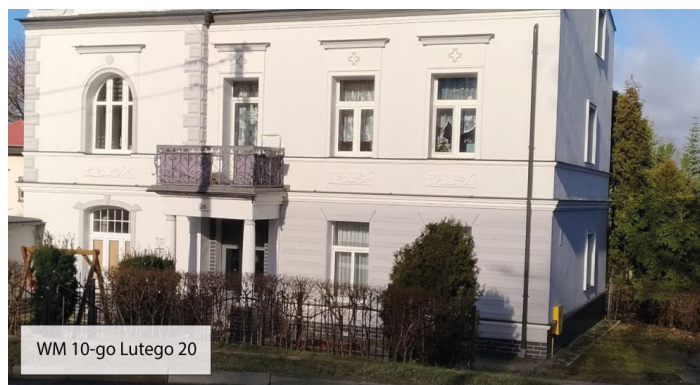
WM 10-go Lutego 20

Wspólnoty, które zakończyły remonty budynków i terenów wokół: