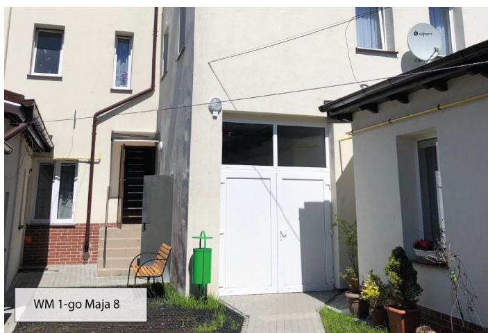
WM 1-go Maja 8