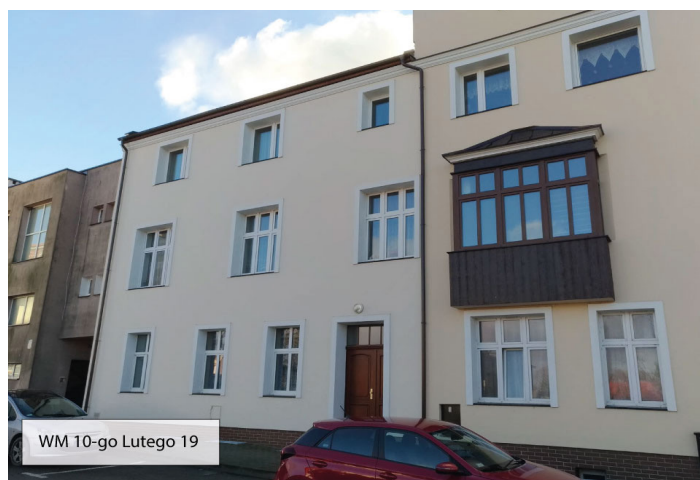
WM 10-go Lutego 19