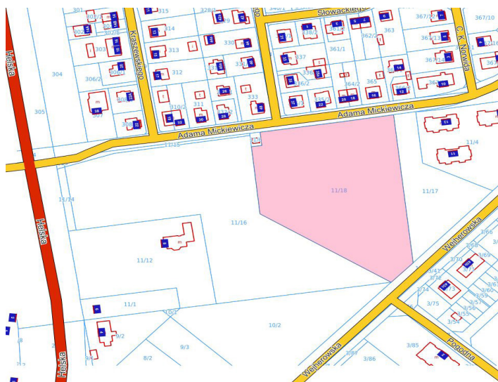
ul. Adama Mickiewicza