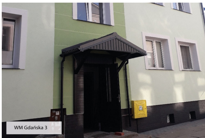
WM Gdańska 3