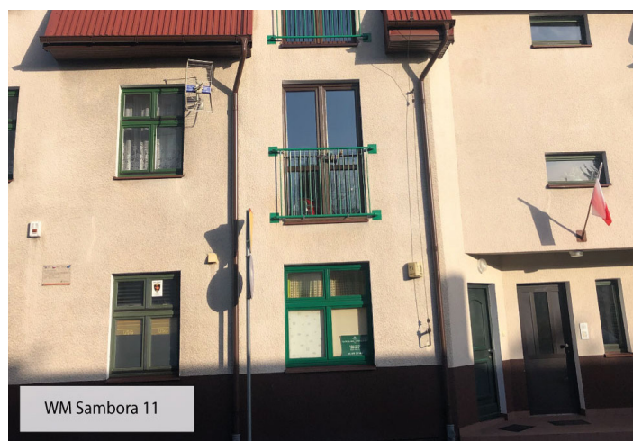
WM Sambora 11