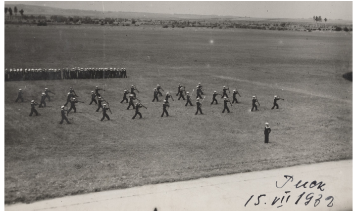
Fot. 2 Pokaz musztry wojskowej marynarzy MDL w dniu garnizonowego święta, Puck 15.07.1932 r.

Wkrótce po zajęciu poniemieckiej bazy przystąpiono do prac porządkowych. Sformowano też Pluton Lotniczy, a 1 lipca 1920 r. do życia powołano Bazę Lotnictwa Morskiego – pierwszą jednostkę polskiego lotnictwa morskiego (w 1923 r. przemianowaną na Morski Dywizjon Lotniczy). W międzyczasie doprowadzono lotnisko do użytku, uruchomiono warsztaty oraz przystąpiono do próby wyremontowania porzuconych przez Niemców hydroplanów.