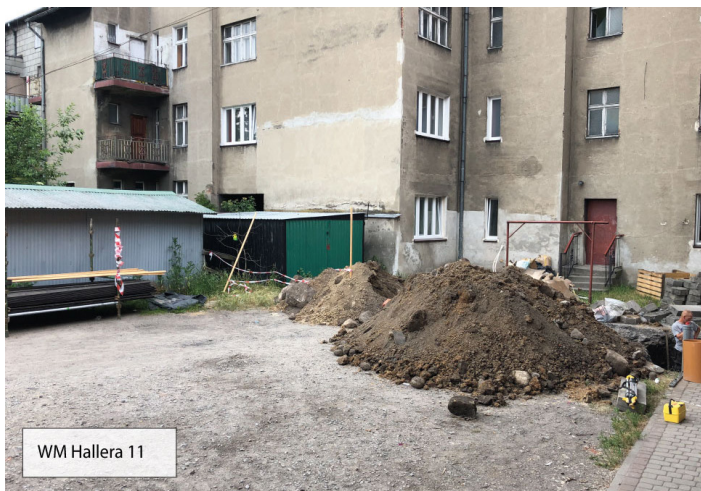
WM Hallera 11

Wspólnota Mieszkaniowa przy ulicy Bogusława 4 realizuje remont w mniejszym zakresie. Ponieważ budynek posiada już odpowiednie docieplenie, członkowie wspólnoty skupili się na wykonaniu remontu klatki schodowej i wykonaniu zagospodarowania terenu ze szczególnym uwzględnieniem odwodnienia przy budynku. W tym przypadku prace potrwać do 29 lipca br.