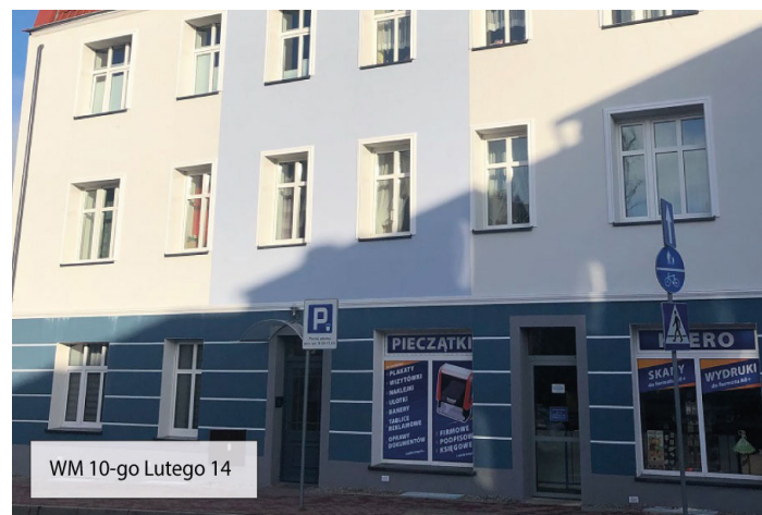
WM 10-go Lutego 14