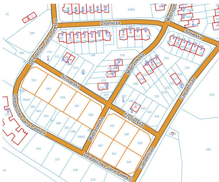
11 działek w rejonie ul. Ślusarskiej