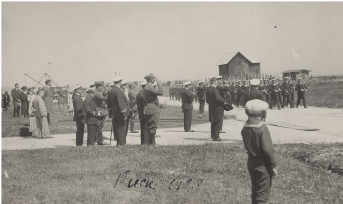
Fot. 1 Defilada podczas święta jednostki, Puck 15.07.1928 r.