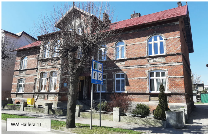
WM Hallera 11

Obecnie prace remontowe prowadzone są w 2 budynkach wspólnot. Wspólnota Mieszkaniowa przy ulicy Generała Józefa Hallera 11 zleciła przemurowanie kominów, uszczelnienie kaletnicy, malowanie okapu, docieplenie dachu, izolację ścian fundamentowych, wymianę stolarki okiennej, zabezpieczenie nadproży w poziomie piwnicy. Ponadto wykonane zostanie odwodnienie terenu, nasadzona zostanie zieleń, pojawią się elementy małej architektury a sam teren zostanie doświetlony. Prace potrwać do 29 lipca br.