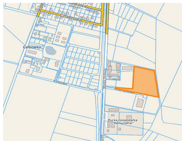
w rejonie ul. Wojska Polskiego