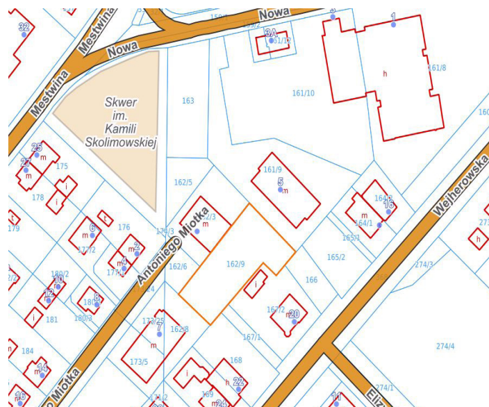
ul. Antoniego Miotka