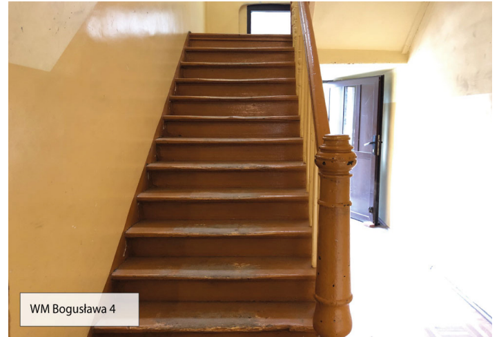
WM Bogusława 4

Wspólnota Mieszkaniowa przy ulicy Bogusława 4 realizuje remont w mniejszym zakresie. Ponieważ budynek posiada już odpowiednie docieplenie, członkowie wspólnoty skupili się na wykonaniu remontu klatki schodowej i wykonaniu zagospodarowania terenu ze szczególnym uwzględnieniem odwodnienia przy budynku. W tym przypadku prace potrwać do 29 lipca br.