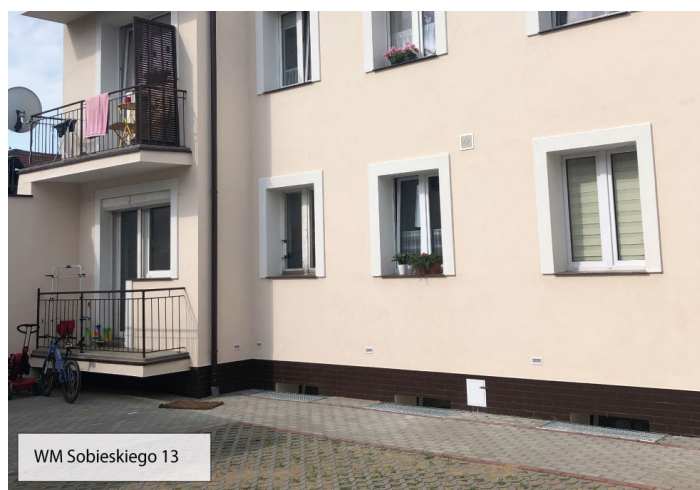
WM Sobieskiego 13