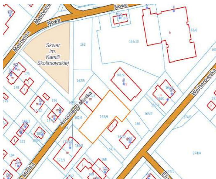
ul. Antoniego Miotka