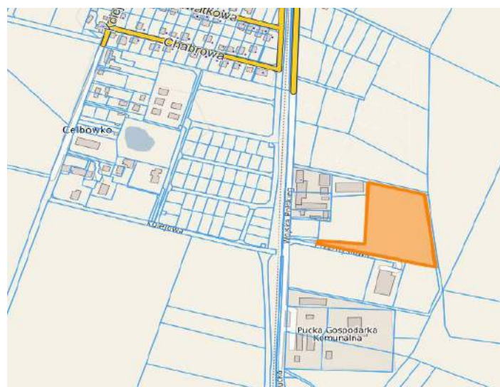
w rejonie ul. Wojska Polskiego