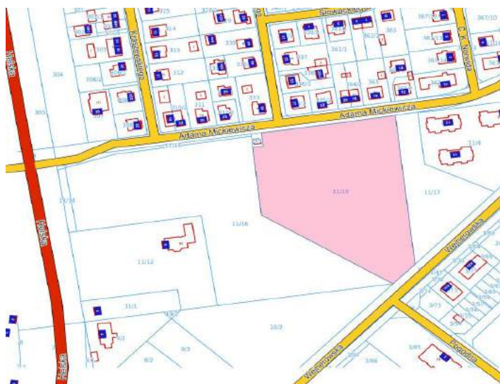
ul. Adama Mickiewicza