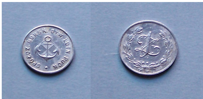
Fot.3 Monety zastępcze o nominale 1 zł (MP/1804/H)

W 1930 roku powstała Spółdzielnia Spożywców Morskiego Dywizjonu Lotniczego w Pucku. 22 października 1930 r. Sąd Powiatowy w Pucku zarejestrował ją pod numerem 28 w spisie stowarzyszeń. Przedmiotem jej działania była działalność handlowa i kulturalno-oświatowa. Wysokość jednego udziału ustalono na 50 zł płatnych w równych ratach miesięcznych. Każdy członek mógł zadeklarować więcej udziałów niż jeden,