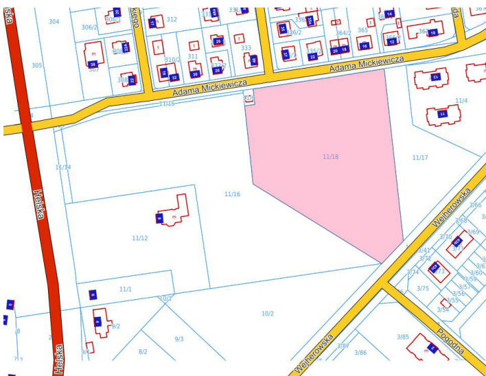
ul. Adama Mickiewicza