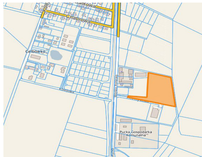
w rejonie ul. Wojska Polskiego