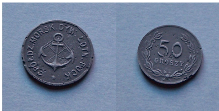
Fot.2 Monety zastępcze o nominale 50 gr (MP/1803/H)

Wojskowe organizacje spółdzielcze powstały również w Pucku przy istniejących w mieście jednostkach. Pierwszą była Spółdzielnia Wojskowa Portu Wojennego Puck. Statut zatwierdził 24 maja 1922 roku Sąd Powiatowy w Pucku i wpisał do rejestru stowarzyszeń pod numerem 19. W rubryce 2 wpisano: Spółdzielnia Wojskowa Portu Wojennego Puck z ograniczoną odpowiedzialnością. W rubryce 3 zapisano: „Dla osiągnięcia określonego w poprzednim paragrafie celu spółdzielnia będzie organizować i prowadzić wszelkiego rodzaju zakłady handlowe, wytwórcze, w szczególności zaś: a) kupować hurtowo, przerabiać i wytwarzać artykuły spożycia, przedmioty użytku żołnierskiego i domowego i odsprzedawać je detalicznie swoim członkom; b) wspierać czytelnię, bibliotekę, świetlicę itp. instytucje oświatowo-kulturalne; c) dzierżawić i nabywać nieruchomości niezbędne dla Spółdzielni”. W rubryce 4 określono udziały członków na 300 mk, z zastrzeżeniem że każdy może nabyć najwyżej sto udziałów. W skład pierwszego zarządu spółdzielni weszli: Aleksander Redzianowski, Roman Molczak, Józef Jarosz.