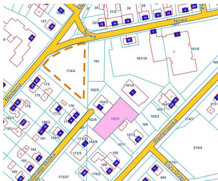
ul. Antoniego Miotka