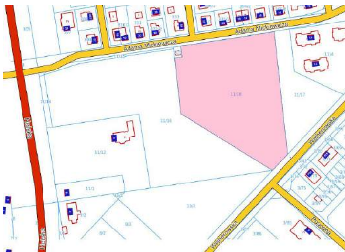
ul. Adama Mickiewicza

położoną przy ul. Antoniego Miotka (przeznaczenie: tereny śródmiejskiej zabudowy mieszkaniowo-usługowej), nieruchomość niezabudowaną położoną w rejonie ul. Wojska Polskiego (przeznaczenie: tereny zabudowy obiektów produkcyjnych, składów i magazynów oraz rzemiosła) oraz nieruchomość niezabudowaną przy ul. Adama Mickiewicza (przeznaczenie: teren zabudowy usługowej oraz usług sportu i rekreacji, bez ustalania proporcji między funkcjami). Dla wszystkich działek w wyżej opisanych lokalizacjach obowiązuje miejscowy plan zagospodarowania przestrzennego.