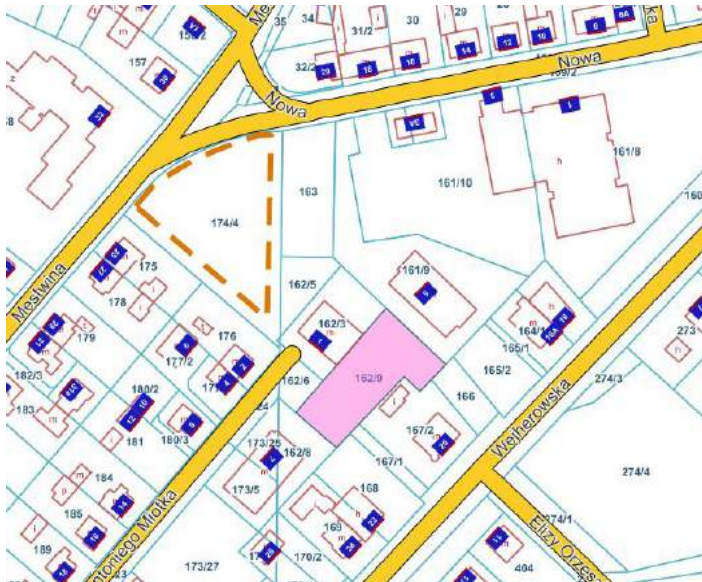
ul. Antoniego Miotka