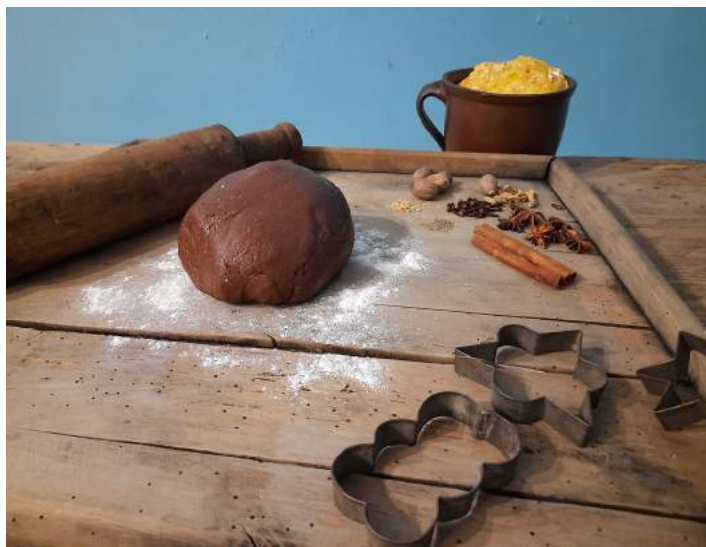
fot. 1 Fragment ekspozycji w Muzeum Ziemi Puckiej – Zapach-smak-piernik, Puck 2022, fot. J. Grochowska.

Pierwsze wzmianki o pierniku na ziemiach polskich pochodzą z XV wieku. Sama nazwa nawiązuje do dawnego słowa „pierny” oznaczającego coś pieprznego. W tamtym czasie pierniki były symbolem bogactwa i zamożności ze względu na drogie, egzotyczne składniki. Początkowo podawano je na dworach królewskich lub w bogatych domach magnatów, mieszczan oraz kupców. Na chłopskie stoły trafiły dopiero w XIX wieku, gdy przyprawy korzenne stały się bardziej dostępne. Dziś ich aromat pierników jest jednym ze zwiastunów Bożego Narodzenia. Aby powstały te ciastka przeważnie o ciekawych i oryginalnych kształtach niezbędne były specjalne akcesoria. Na początku używano do formowania kształtów drewnianych, metalowych lub woskowych form. Uzyskiwano dzięki ich zastosowaniu kunsztowne