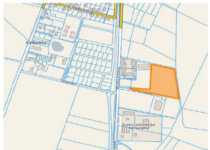
w rejonie ul. Wojska Polskiego