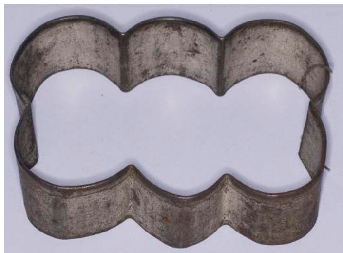
Fot.2 Foremki do pierników, zbiory Muzeum Ziemi Puckiej, Puck 2022, fot. J. Grochowska.

Dziś te wyjątkowe foremki – kształt przedwojennych pierników można zobaczyć wśród innych obiektów na wystawie czasowej w Muzeum Ziemi Puckiej – oddział „Szpitalik”, Wałowa 11. Wystawa Zapach-smak-piernik. Wokół piernikowych ciast wprowadza nas w świąteczny nastrój. Warto przyjść i zobaczyć z czego powstaje piernik i jak smacznie może być w muzeum.