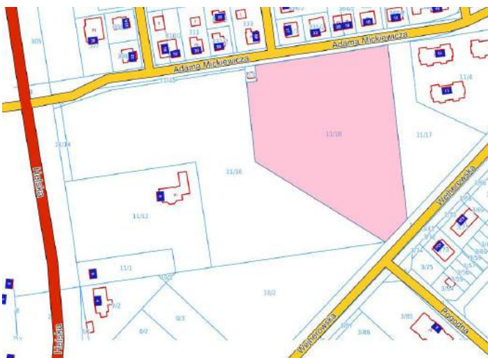
ul. Adama Mickiewicza