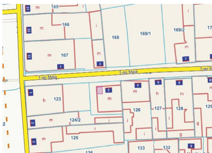
lokal użytkowy ul. 1-go Maja 2