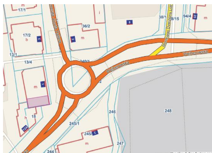
lokal użytkowy ul. Hallera 1