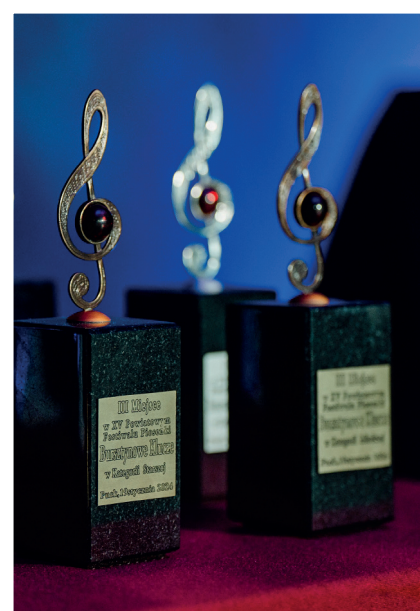
BURSZTYNOWE KLUCZE - STR. 6