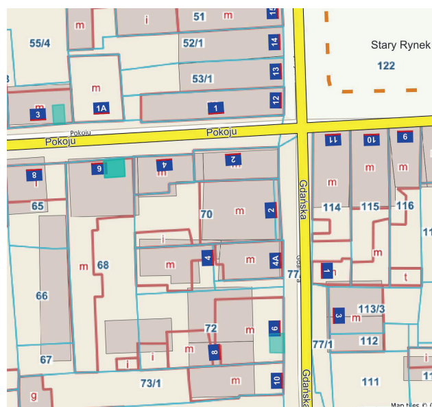
Lokale użytkowe przy ul. Pokoju 3, 6 i ul. Gdańskiej 6

Miasto Puck posiada w swojej ofercie lokale użytkowe do dzierżawy/najmu: lokal użytkowy położony przy ul. Pokoju 6 (przeznaczenie: biuro, punkt usługowy), lokal użytkowy położony przy ul. Pokoju 3 (przeznaczenie: biuro, punkt usługowy) oraz lokal użytkowy przy ul. Gdańska 6 (przeznaczenie: biuro, punkt usługowy).