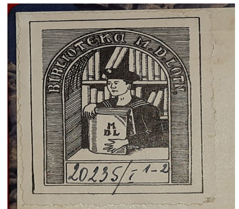
Fot. Ekslibris biblioteki Morskiego Dywizjonu Lotniczego w Pucku, fot. J. Grochowska.