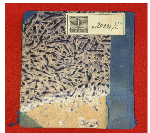
Fot. Ekslibris biblioteki Morskiego Dywizjonu Lotniczego w Pucku, fot. J. Grochowska.