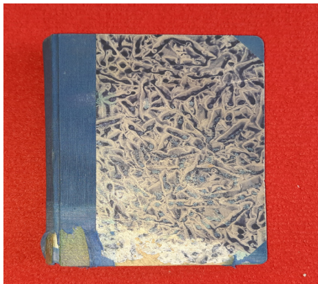
Fot. Książka, A. Dumas, Pamiętniki lekarza. Józef Balsamo, nr.inw. MZP-H-5186

W zbiorach Muzeum Ziemi Puckiej znajduje się wiele książek, które ze względu na swoje dodatkowe „cechy charakterystyczne” znalazły miejsce w muzealnych magazynach. Często są to popularne, wielonakładowe wydawnictwa jak chociażby podręczniki szkolne czy powieści. Jednak spośród innych, im podobnych wyróżniają je ich losy, pochodzenie czy przeznaczenie. Do muzealnej kolekcji trafiły, bo np. ich poprzednimi właścicielami były ważne dla Pucka osoby lub instytucje, które pozostawiły w książkach swoje ślady – autografy, wpisy, notatki, pieczątki. Przykładem takiego zabytku jest powieść – romansidło wydane w 1925 r. przez wydawnictwo E. Wende i S-ka z Warszawy w ramach biblioteczki przygód romantycznych pt. Pamiętniki Lekarza. Józef Balsamo autorstwa Aleksandra Dumasa. Ta niewielka rozmiarem książka została przekazana do zbiorów Muzeum w 2019 r. przez kolekcjonera puckich pamiątek Mirosława Radomskiego.