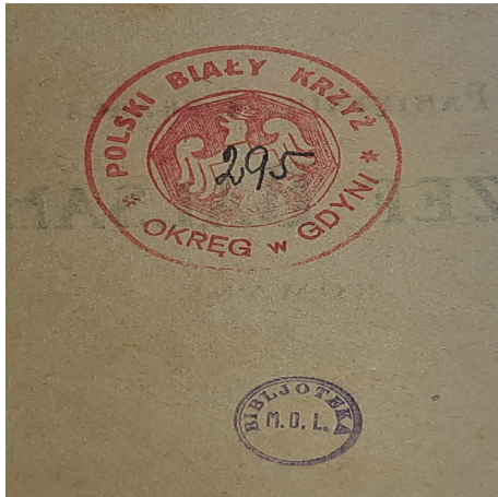
Fot. Pieczątki biblioteczne, fot. J. Grochowska.

jest świadectwem historii miasta Pucka, historii wojskowości na Pomorzu oraz życia społeczno - kulturalnego. Zanim jednak trafiła do zbiorów muzealnych i stała się zabytkiem wędrowała po wielu miejscach, o czym świadczą widoczne na jej kartach odciski pieczęci. Prawdopodobnie jej pierwszym właścicielem była biblioteka Polskiego Białego Krzyża, okręg w Gdyni. Fot.