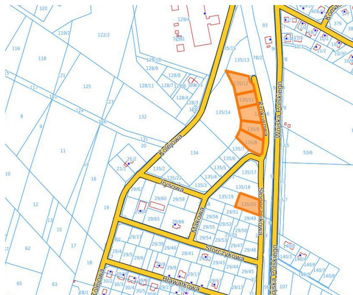
ul. SŁONECZNIKOWA I KROKUSOWA