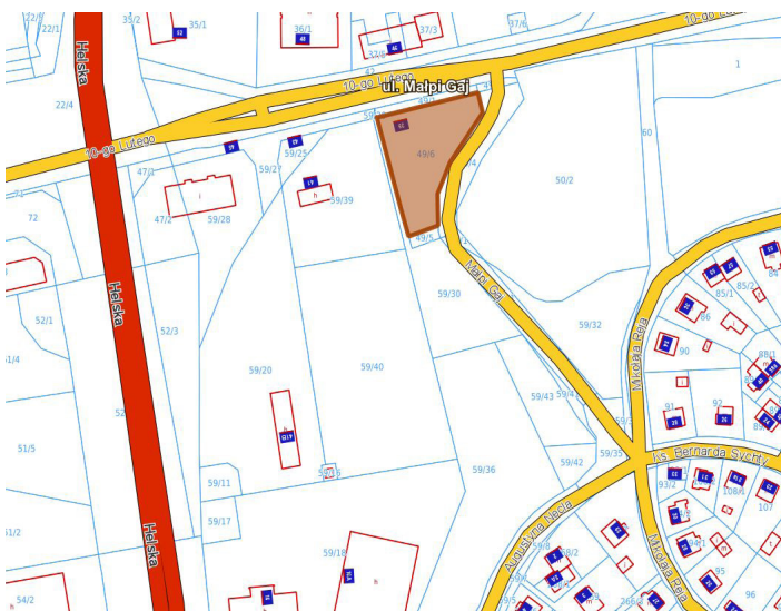
ul. MAŁPI GAJ