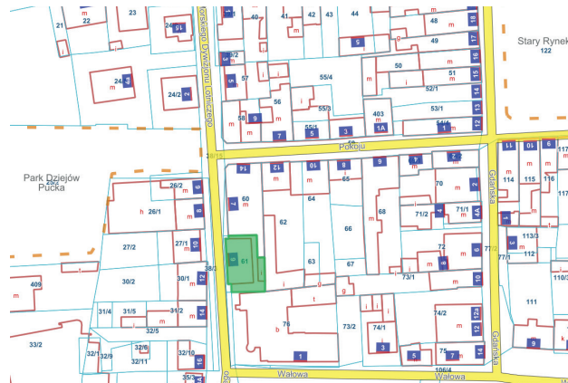
Działka przy ul. Morskiego Dywizjonu Lotniczego 9

Miasto Puck posiada w swojej ofercie w tej chwili 1 lokal użytkowy do dzierżawy/najmu, lokal użytkowy położony jest przy ul. Gdańskiej 6 (przeznaczenie: biuro, punkt usługowy).