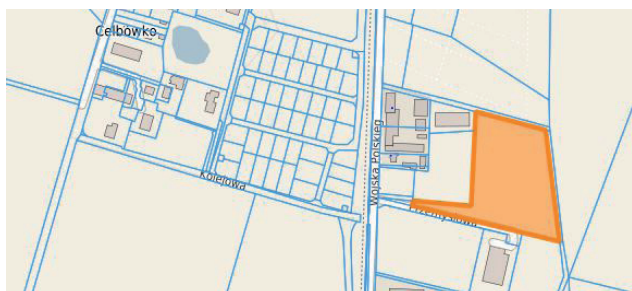
Działka w rejonie ul. Wojska Polskiego