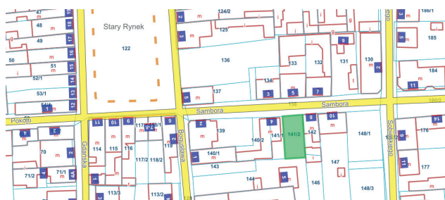
Działka przy ul. Sambora