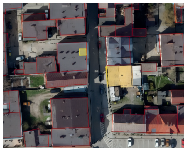
Lokal użytkowy przy ul. Gdańskiej 6 (żółty kwadrat)

Miasto Puck posiada w swojej ofercie w tej chwili 1 lokal użytkowy do dzierżawy/najmu, lokal użytkowy położony jest przy ul. Gdańskiej 6 (przeznaczenie: biuro, punkt usługowy).