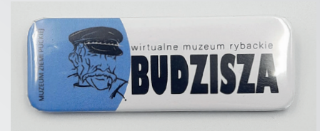
Wirtualne Muzeum Rybackie Budziszza – przypinka pamiątkowa z logotypem

Wirtualne Muzeum Rybackie Józefa Budziszza jest inicjatywą mającą na celu przybliżyć sylwetkę tej, zasłużonej dla kultury wybrzeża postaci, oraz ocalić od zapomnienia jej dzieło. Wirtualna przestrzeń jest miejscem, w którym można ponownie obejrzeć, zwiedzić, poznać i docenić pasję puckiego rybaka. Organizatorem tej nietypowej wystawy jest Muzeum Ziemi Puckiej, które obecnie nie dysponuje miejscem, w którym mogłoby na stałe, w przestrzeni muzealnej ekspozycjonować „budziszową” kolekcję. By temu zaradzić, w 2023 r. Muzeum złożyło wnioski na realizację pomysłu wystawy w internecie. Projekt uzyskał dotację z Ministerstwa Kultury i Dziedzictwa Narodowego w ramach programu „Wspieranie działań muzealnych” na organizację wystaw wirtualnych. Partnerami projektu zostali: Powiat Pucki, Stowarzy-