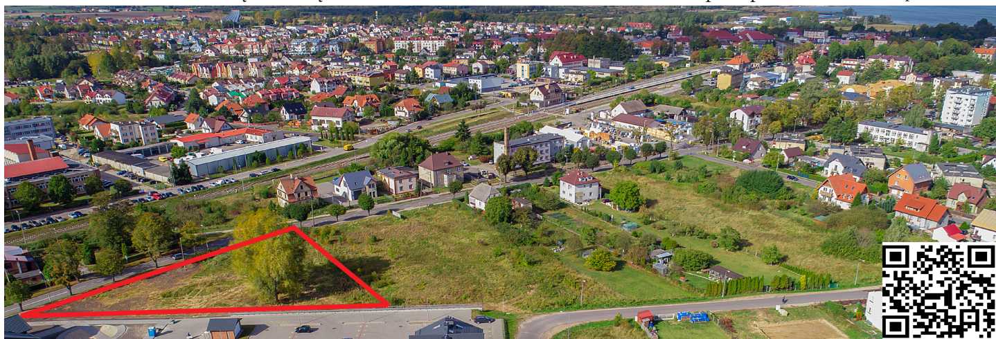
NIERUCHOMOŚCI PRZY UL. WOJSKA POLSKIEGO

miastopuck.pl zakładka – Inwestycje / Nieruchomości oraz na stronie bip.miastopuck.pl zakładka - Gospodarka nieruchomościami Zbywanie nieruchomości. Dodatkowe informacje można uzyskać w Urzędzie Miasta Puck, w Referacie Gospodarki Nieruchomościami i Planowania Przestrzennego, ul. 1-go Maja 13, 84-100 Puck (1 piętro, pok. 101), tel. 58 673-05-22 lub kierując pytanie na adres poczty elektronicznej nieruchomosci@miastopuck.pl (oprac. K. Derc)