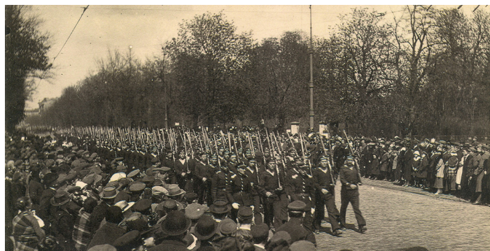
Fot. Defilada Batalionu Morskiego w Warszawie, 3 VI 1919