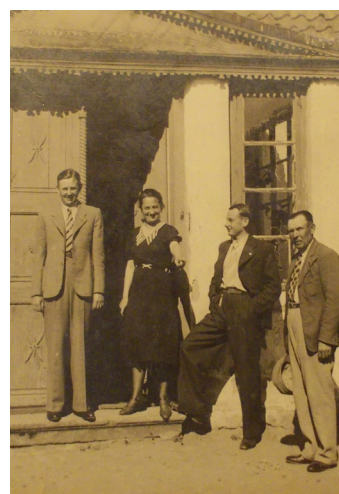
fot. Dwór Eugenii i Michała Krępskich lata 30.) fot. Nagrobek rodu Krępskich, Wieczfnia