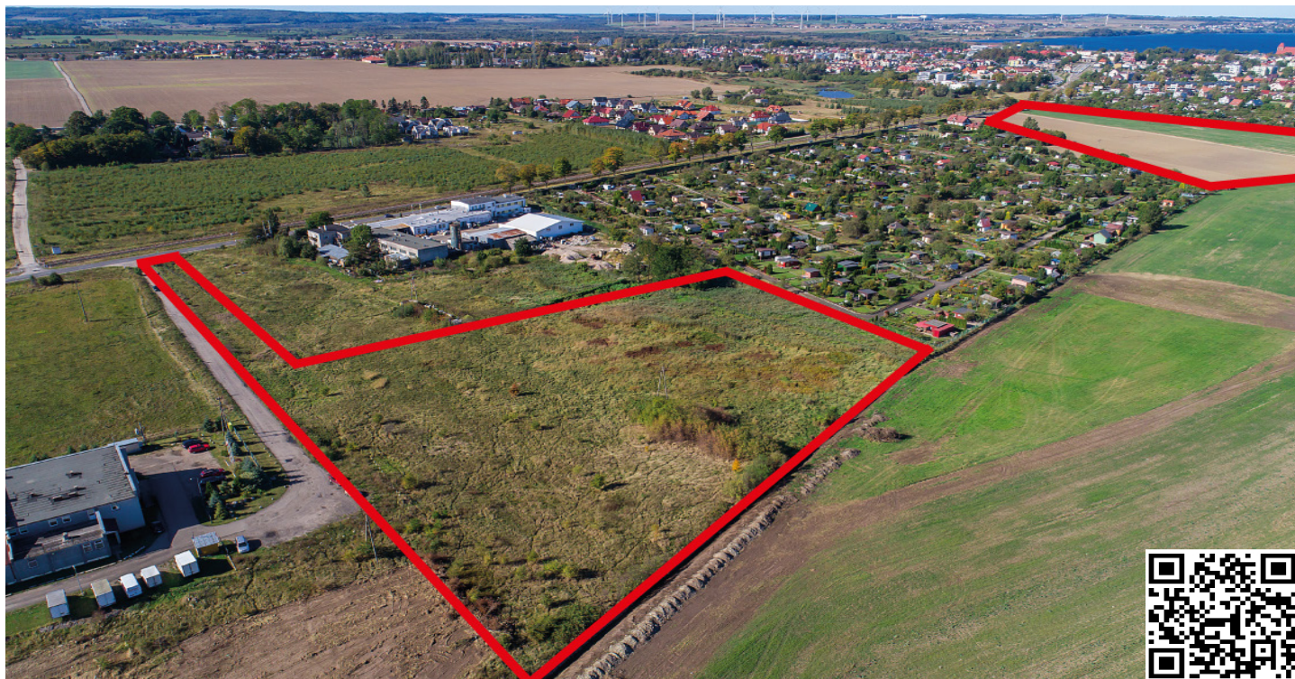
NIERUCHOMOŚCI PRZY UL. WOJSKA POLSKIEGO