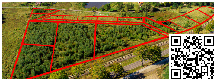
NIERUCHOMOŚCI PRZY ULICY MAKOWEJ, IRYSOWEJ, SŁONECZNIKOWEJ ORAZ KROKUSOWEJ

Dla wszystkich działek w wyżej opisanych lokalizacjach obowiązuje miejscowy plan zagospodarowania przestrzennego. Wszystkie szczegółowe informacje dotyczące sprzedaży nieruchomości zamieszczane są na bieżąco, na stronie www.miastopuck.pl