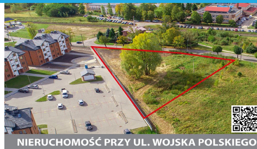
NIERUCHOMOŚĆ PRZY UL. WOJSKA POLSKIEGO

Dla wszystkich działek w wyżej opisanych lokalizacjach obowiązuje miejscowy plan zagospodarowania przestrzennego. Wszystkie szczegółowe informacje dotyczące sprzedaży nieruchomości zamieszczane są na bieżąco, na stronie www.miastopuck.pl zakładka – Inwestycje / Nieruchomości oraz na stronie bip.miastopuck.pl zakładka - Gospodarka nieruchomościami / Zbywanie nieruchomości. Dodatkowe informacje można uzyskać w Urzędzie Miasta Puck Referacie Gospodarki Nieruchomościami i Planowania Przestrzennego,