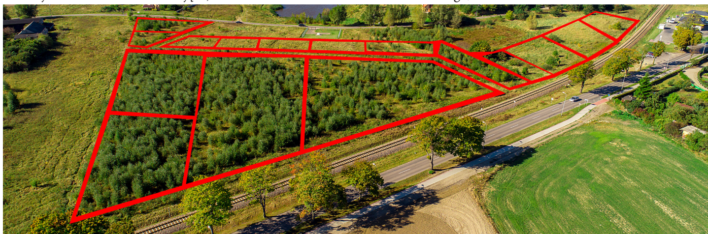
NIERUCHOMOŚCI PRZY UL. MAKOWEJ, IRYSOWEJ, SŁONECZNIKOWEJ ORAZ KROKUSOWEJ