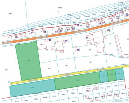
Działki przy ul. Pradoliny i Żarnowieckiej

w mpzp: teren obiektów produkcyjnych, składów i magazynów oraz zabudowy usługowej, bez ustalania proporcji między funkcjami). Przetarg na sprzedaż tej nieruchomości odbędzie się dnia 23 lipca 2026 r.