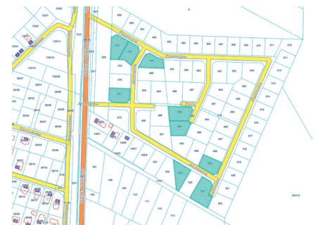
Działki opisane w pkt 6

rodzinną wolnostojącą, położone w Pucku przy ul. Pszenicznej, ul. Jęczmiennej i ul. Żytniej. Dla powyższych nieruchomości będą organizowane kolejne przetargi.