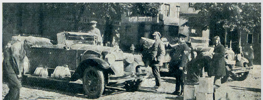
„Świat”, 26.07.1924 nr 30.