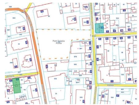
Działki przy ul. Pokoju 9 i Mestwina 3