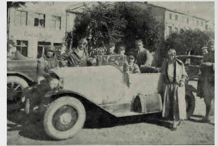
„Świat”, 26.07.1924 nr 30.

zywały się patetyczne, czasami romantyczne opisy trasy. Takie jak ten z czasopisma „Świt” nr 29 z 1924 roku, w którym czytamy, że: Drugi dzień podróży obfitował w niespodzianki i wypadki. Uczestnicy Raidu długo pamiętać będą zasadzki nagłych zakrętów, strome wiraże podgórskie i serpenty, wymagające od kierowców przytomności umysłu i pewności ręki. Po trudach 5 marszrut automobile, jadąc z Kartuz przez Łebno i lekko mijając Wejherowo, kierowały się do Pucka. Drogę tę opisano w materiałach dla kierowców jako: Droga ta idzie wysokim gęstym lasem, zmieniając ciągle kierunek i nie należy się dać zmylić napisami, które wskazują drogę do Pucka, lecz jechać ciągle do Krokowa (Krokowa). Ze względu na bliskość granicy pobudowano tutaj dużo nowych dróg, a także szosa, którą my podążamy i która idzie ku wybrzeżu jest b. dobrze utrzymana. Kroków, miasteczko rybackie o charakterystycznym wyglądzie miejscowości nadmorskich jest tylko 6 km. Oddalone od brzegu morza. Droga skręca