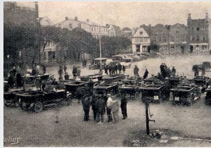
„Świat”, 19.07.1924 nr 29.

W dniach 7–12 lipca 1924 roku odbył się IV Międzynarodowy Raid Automobilowy, zorganizowany przez Automobilklub Polski. Do wyścigu – pomimo, jak napisano, „niesłychanie uciążliwych warunków jazdy konkursowej, mimo długości marszruty –2483 klm.” – zgłosiło się 28 maszyn, z czego wystartowały 24. Raid rozpoczął się w Warszawie, na placu Saskim pod pomnikiem księcia Józefa Poniatowskiego, 7 lipca o godzinie 12.00 w nocy. Na starcie zgromadziła się liczna publiczność, która w oślepiających światłach wojskowych reflektorów obserwowała odjazd kolejnych pojazdów. Wyścig rozpisano na 6 etapów: 1. Warszawa–Zamość (598 km), 2. Zamość–Zakopane (451,5 km), 3. Zakopane–Morskie Oko–Kraków (155,9 km), 4. Kraków–Poznań (460 km), 5. Poznań–Puck (414 km), 6. Puck–Warszawa (412 km). Cała rywalizacja miała ściśle określone zasady i regulamin. Jeden z jego punktów dotyczył zaopatrywania się w paliwo. Benzynę i oliwę uczestnicy mogli pobierać na specjalne bony Towarzystwa „Oleum” w przygotowanych punktach. Jeden z nich mieścił się na puckim rynku. Również na tzw. park samochodowy, czyli postój podczas wyścigu, wytypowano miejsce pośród 6 głównych punktów etapowych: Puck-Rynek („Auto” nr 13, 1924). Wyścig ruszył, a w prasie uka-