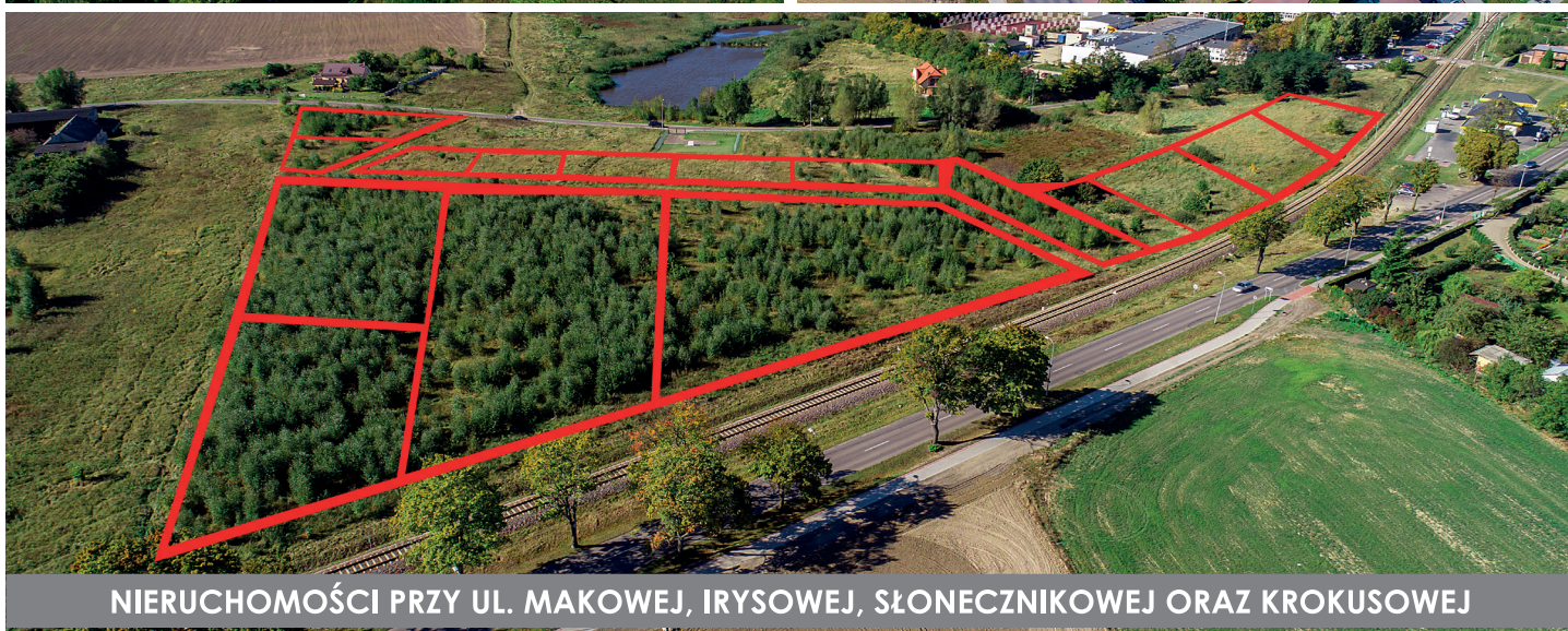
NIERUCHOMOŚCI PRZY UL. MAKOWEJ, IRYSOWEJ, SŁONECZNIKOWEJ ORAZ KROKUSOWEJ