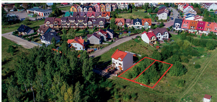
NIERUCHOMOŚĆ PRZY UL. FRYZJERSKIEJ