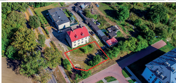
NIERUCHOMOŚĆ PRZY UL. POGODNEJ