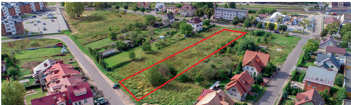
NIERUCHOMOŚĆ PRZY UL. ABRAHAMA

Dodatkowe informacje można uzyskać w Urzędzie Miasta Puck w Referacie Gospodarki Nieruchomościami i Planowania Przestrzennego, ul. 1-go Maja 13, 84-100 Puck (1 piętro, pok. 101), tel. 58 673-05-22. (oprac. K. Derc)