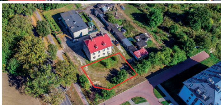
NIERUCHOMOŚĆ PRZY UL. POGODNEJ