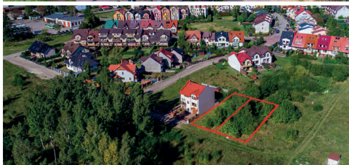
NIERUCHOMOŚĆ PRZY UL. FRYZJERSKIEJ