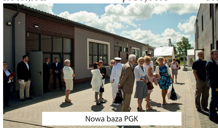
Nowa baza PGK