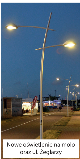
Nowe oświetlenie na moło oraz ul. Żeglarszy

26. Realizacja programu „Czyste powietrze Miasta