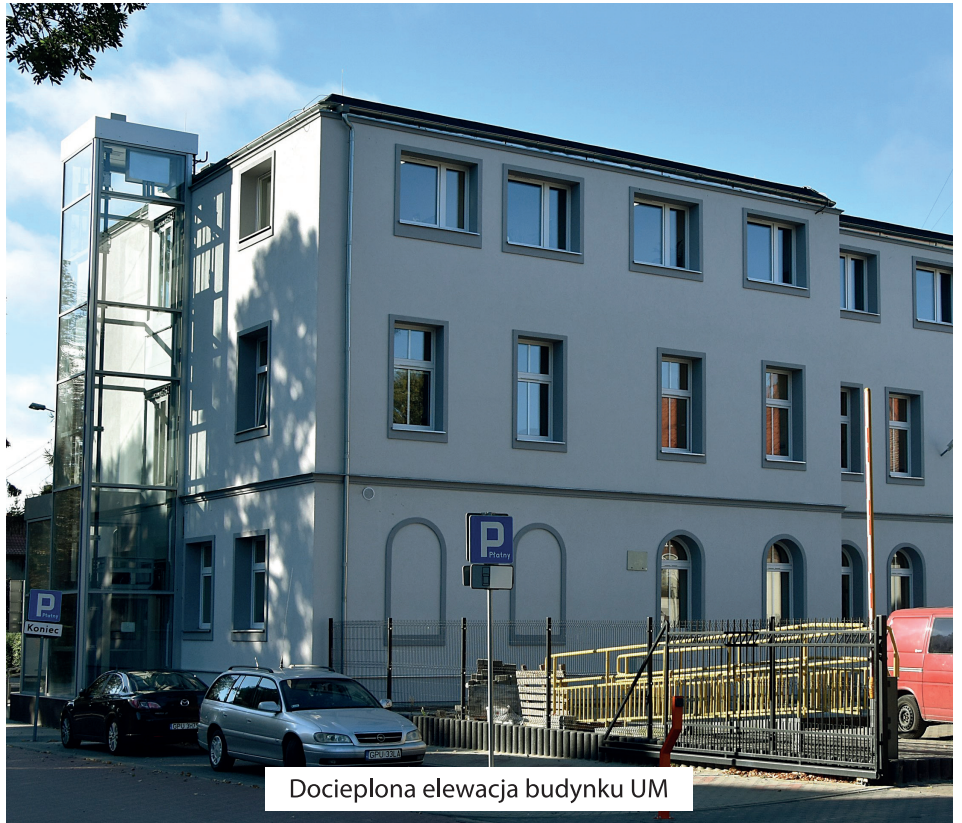
Docieplona elewacja budynku UM

Całościowy koszt projektu to 7.968.256,00 zł dofinansowanie z budżetu Unii Europejskiej wynosi 3.106.533,00 zł. Poniżej w ujęciu na