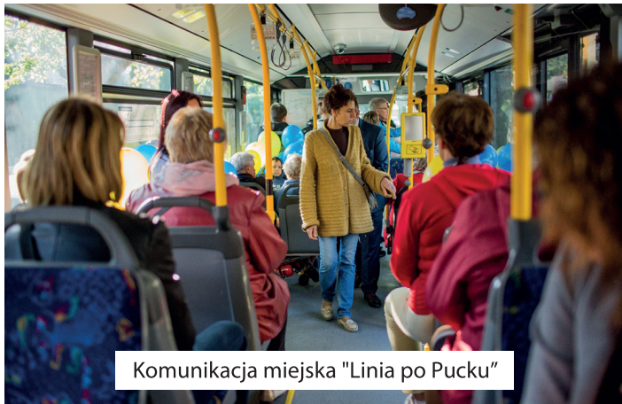
Komunikacja miejska "Linia po Pucku"

pieszych dostosowane dla osób niepełnosprawnych