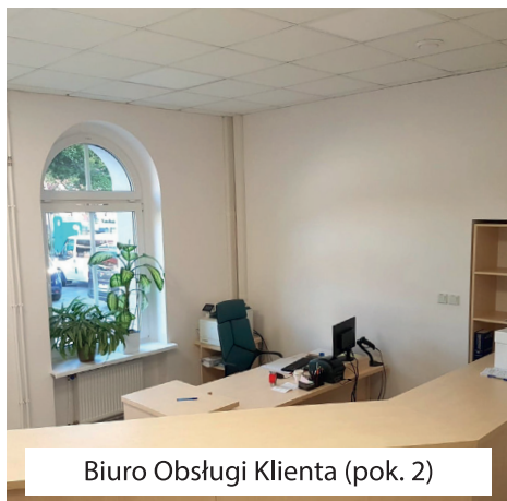
Biuro Obsługi Klienta (pok. 2)