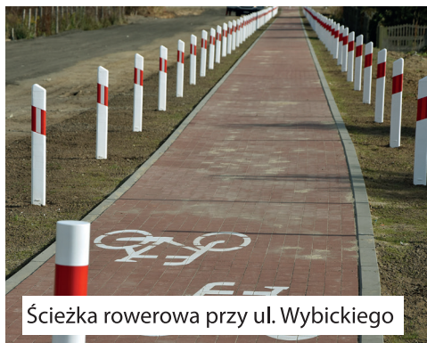
Ścieżka rowerowa przy ul. Wybickiego