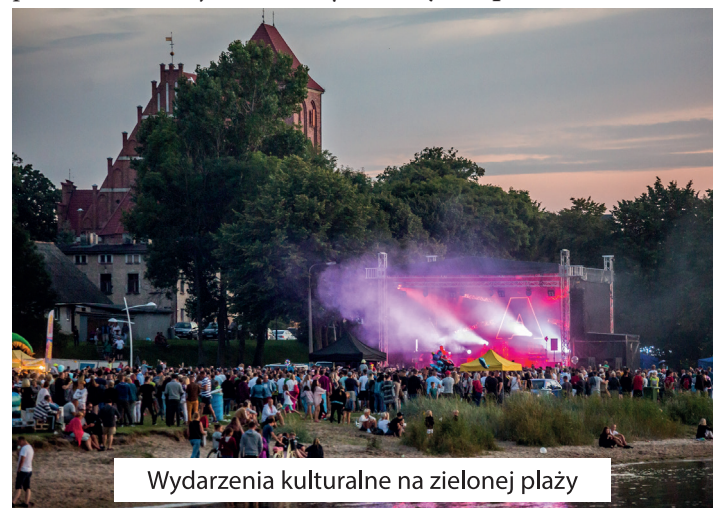
Wydarzenia kulturalne na zielonej plaży