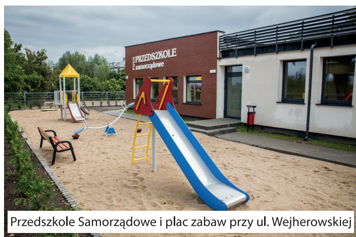
Przedszkole Samorządowe i plac zabaw przy ul. Wejherowskiej

4. Uruchomiliśmy w Pucku budżet obywatelski- trzy edycje , przeznaczaliśmy rocznie na ten cel od 230 000 zł (2015) do 270 000 zł (2018). W jego ramach powstały m.in: - chodnik przy ul. Swarzewskiej - ulica Chabrowa - parking dla samolotów przy Muzeum MDL-otu - wydarzenie „Morsy Puck” i działalność chóru „Muszelki” - plac zabaw przy przedszkolu samorządowym - p r e j ś c i a d l a