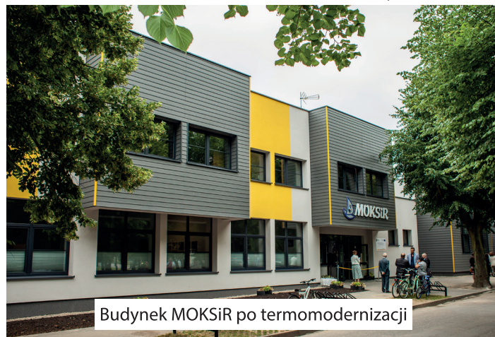
Budynek MOKSiR po termomodernizacji

współpraca, wsparcie miasta poprzez granty- 370 000 zł rocznie, dofinansowanie w kalendarzu imprez miejskich i rzeczowe.