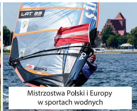
Mistrzostwa Polski i Europy w sportach wodnych