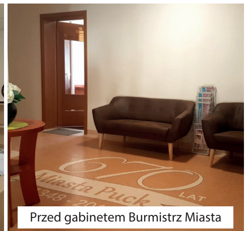
Przed gabinetem Burmistrz Miasta