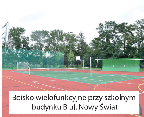
Boisko wielofunkcyjne przy szkolnym budynku B ul. Nowy Świat