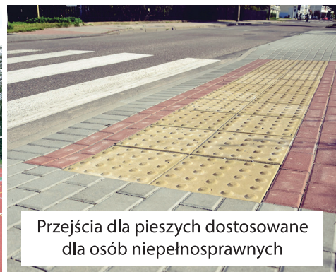
Przejścia dla pieszych dostosowane dla osób niepełnosprawnych