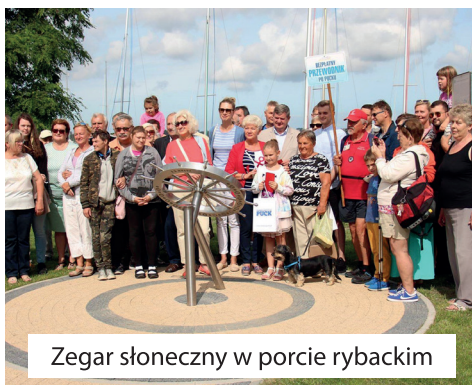
Zegar słoneczny w porcie rybackim