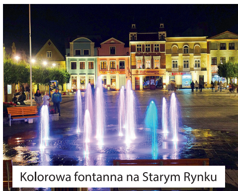
Kolorowa fontanna na Starym Rynku